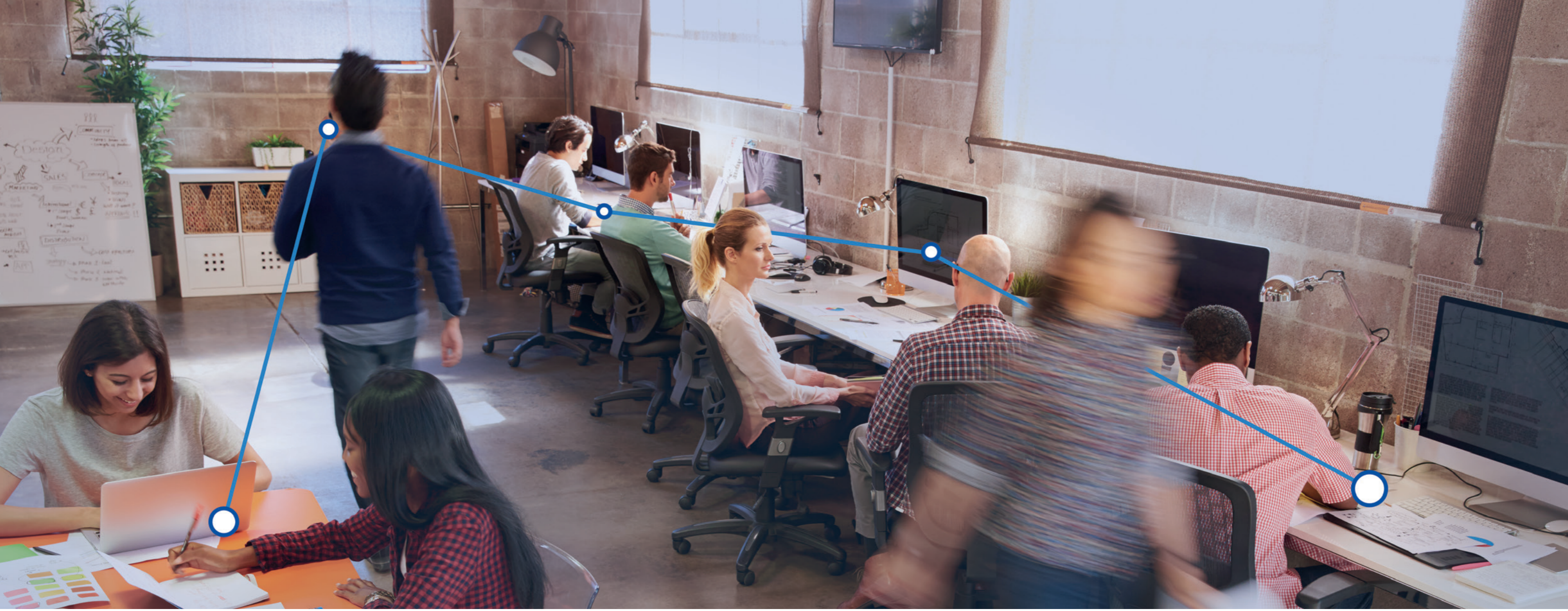
Birden Çok Cihaz